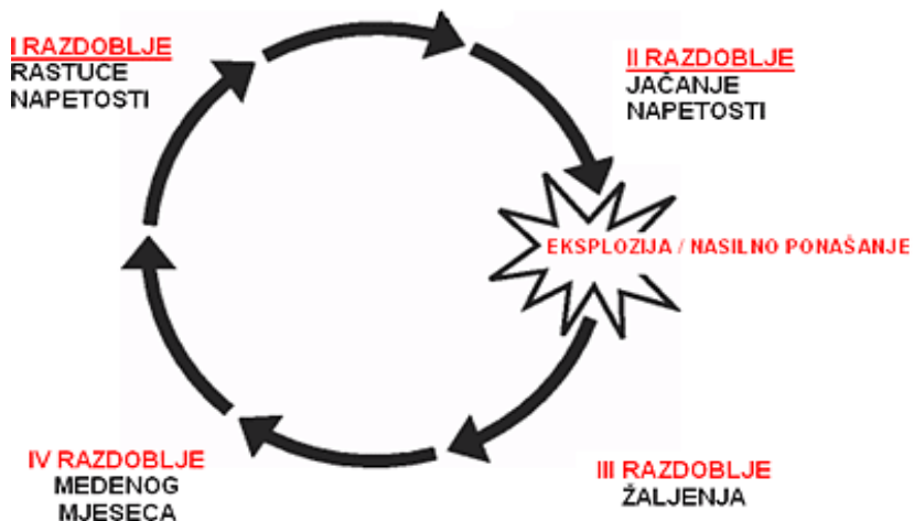
Slika 2. Krug nasilja u porodici

U prvoj fazi partnerskog odnosa komunikacija među partnerima se odvija u relativno ugodnoj klimi bez značajnijih poremećaja u komunikaciji. Za ovu fazu nisu svojstveni nasilnički oblici ponašanja. Za drugu fazu je svojstveno stvaranje atmosfere koju odlikuju tenzije i rastuća napetost koja se pojavljuje u svakodnevnim situacijama, a u kojoj nasilni partner zahtijeva ili uskraćuje potrebe žrtve. Građenje napetosti uslovljava nastanak nasilničkog ponašanja čime se izaziva osjećaj šoka, nevjerice, boli, povrijeđenosti od strane žrtve. Odmah nakon nasilničkog ponašanja slijedi faza žaljenja u kojoj zlostavljač izražava žaljenje i